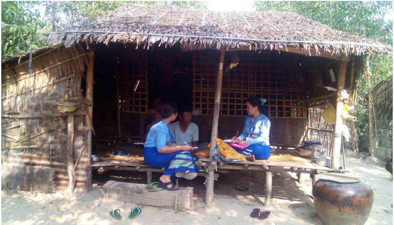
အလုပ်သမားညွှန်ကြားရေးဦးစီးဌာနမှ ဝန်ထမ်းများ ၂၀၁၈ ခုနှစ်၊ နှစ်စဉ်လုပ်သားအင်အားစစ်တမ်း (ပထမအကြိမ်) ကွင်းဆင်းကောက်ယူနေပုံ