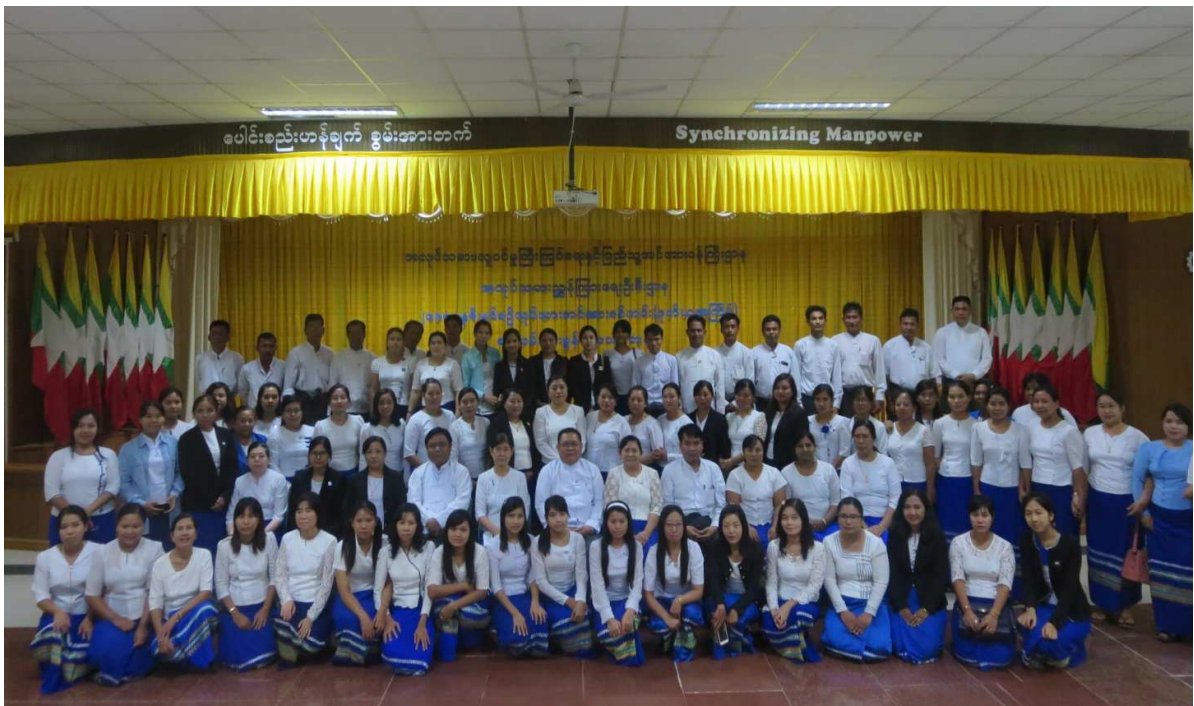
၂၀၁၈ ခုနှစ်၊ နှစ်စဉ်လုပ်သားအင်အားစစ်တမ်း (ပထမအကြိမ်) စစ်တမ်းမေးခွန်းလွှာသင်တန်း မှတ်တမ်းဓါတ်ပုံ