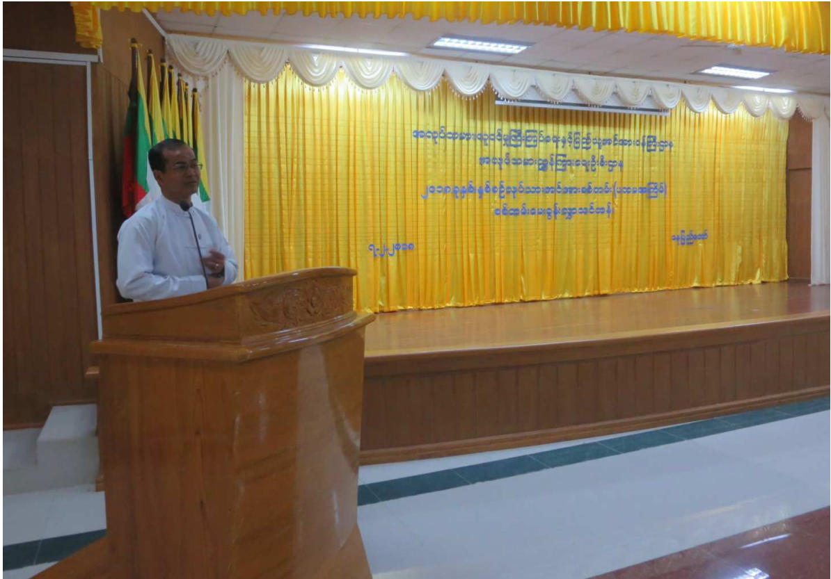
၂၀၁၈ ခုနှစ်၊ နှစ်စဉ်လုပ်သားအင်အားစစ်တမ်း (ပထမအကြိမ်) စစ်တမ်းမေးခွန်းလွှာသင်တန်းတွင် ညွှန်ကြားရေးမှူးချုပ်မှ အမှာစကားပြောကြားနေပုံ