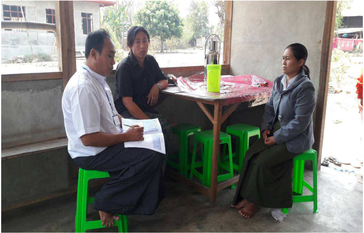
အလုပ်သမားညွှန်ကြားရေးဦးစီးဌာနမှ ဝန်ထမ်းများ ၂၀၁၈ ခုနှစ်၊ နှစ်စဉ်လုပ်သားအင်အားစစ်တမ်း (ပထမအကြိမ်) ကွင်းဆင်းကောက်ယူနေပုံ